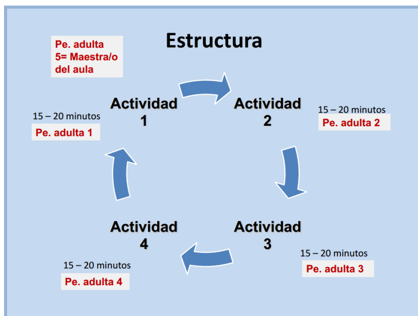
Figura. Estructura de funcionamiento de los grupos interactivos